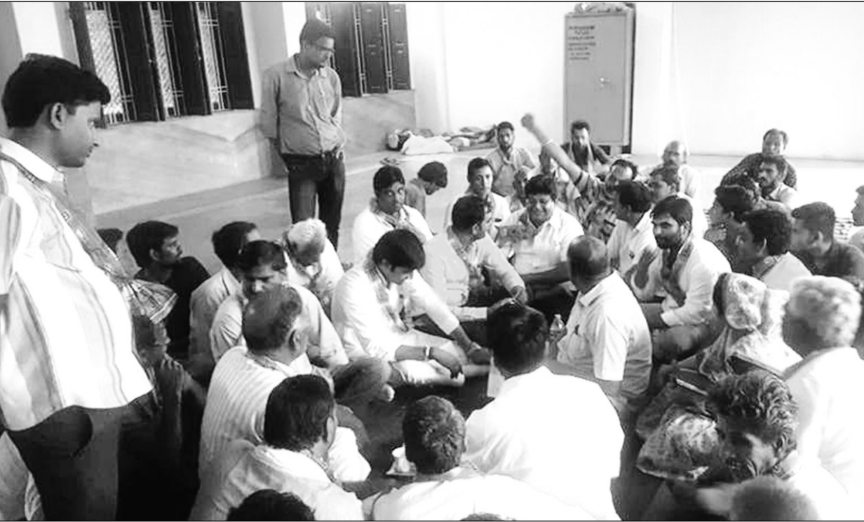
बृथ महासंपर्क अभियान के तहत बगरु विधायक व संसदीय सचिव डॉ. कैलाश वर्मा ने बृथ नंबर 12, 16, 18, 19, 22, 23, 24, पर कार्यकर्ताओं के साथ मीटिंग की। वर्मा ने केंद्र व राज्य सरकार की ओर से चलाई जा रही योजनाओं के बारे में चर्चा की।